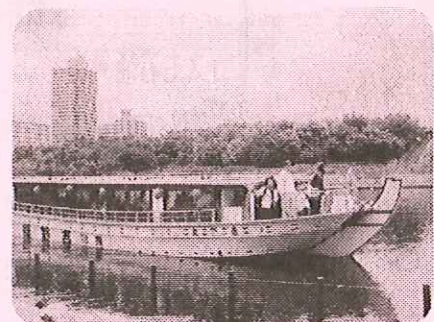
屋形船で、巡ります！