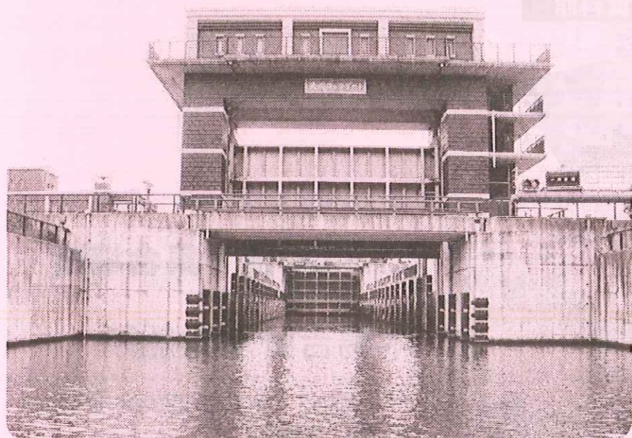
荒川ロックゲート

小名木川から木場、荒川ロックゲート（番所橋 - 隅田川 - 木場・木場 - 荒川 - 番所橋）の歴史や名所を船でご案内！江東区の風景を川面から楽しみませんか。